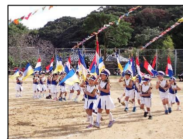
11 月 親子運動会

年間行事は親子で楽しめるイベントや園児のみで行う行事があります。保護者様の負担を考慮して保護者参加の行事は土曜日を基本に必要最小限度に設定しております。