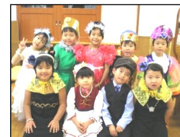
12 月 遊戯会

運動会や遊戯会、誕生会、乗馬体験、イチゴ狩り等の他にプロのミュージシャンを招いてのコンサートなどスポットイベントも行われます。